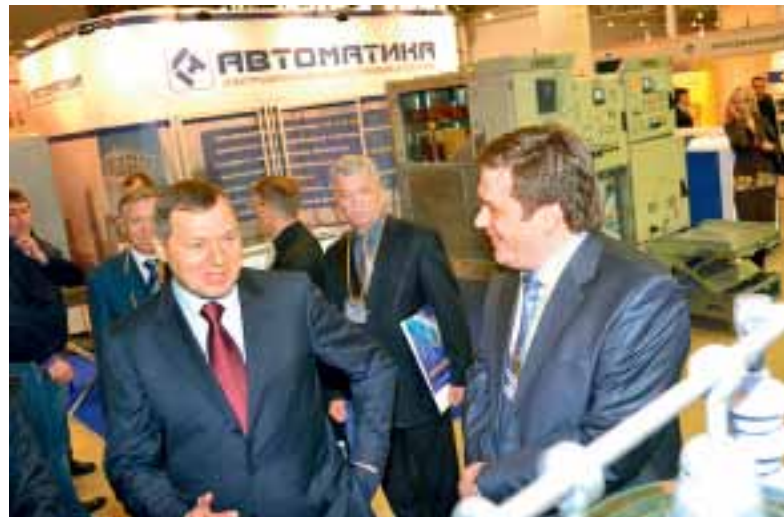
Глава ФСК ЕЭС Олег Бударгин у стенда завода на выставке «Электрические сети России – 2011»

конкуренцию это я не для красного словца – факт наличия таковой засвидетельствован в решении арбитражного суда Екатеринбурга. По сути, это беспрецедентный случай в отраслевой практике.