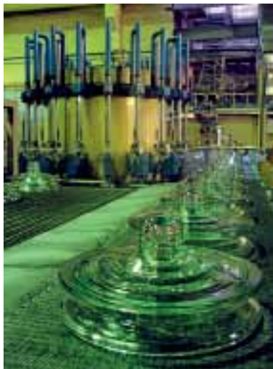
В цехах завода