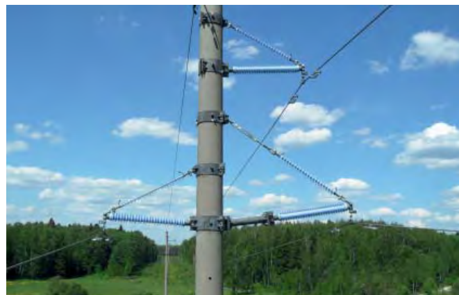
Изолирующие траверсы ООО «ИНСТА» на ВЛ 110 кВ

Испытательная лаборатория «ИНСТА-СИЛ» имеет право проводить работы по оценке соответствия продукции требованиям технических регламентов Евразийского экономического союза (Таможенного союза) в соответствии с действующей областью аккредитации.