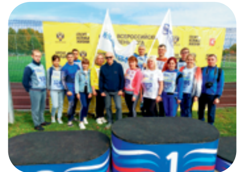
5. Май 2023: участие в 88-й легкоатлетической эстафете на призы газеты «ИСКРА» среди учебных заведений и производственных коллективов в зачет городской комплексной Спартакиады.