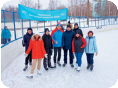
7. 4-5 марта состоялся «Международный Деминский марафон», в котором принял участие сотрудник ООО «МЗВА-ЧЭМЗ».