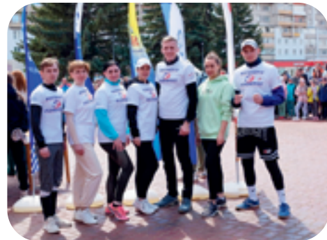
14. 07.05.2023: состоялся Велопробег «Дорога Памяти», посвященный Дню Победы. В нем приняли участие 10 сотрудников.