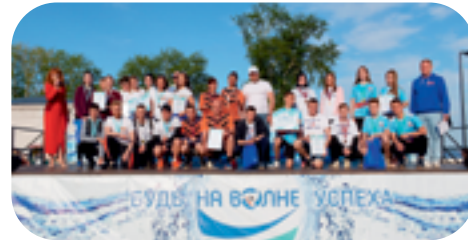
19. Июнь 2023: Муниципальный фестиваль ВФСК ГТО в зачет Спартакиады трудовых коллективов. В нем приняли участие 10 сотрудников «МЗВА-ЧЭМЗ».