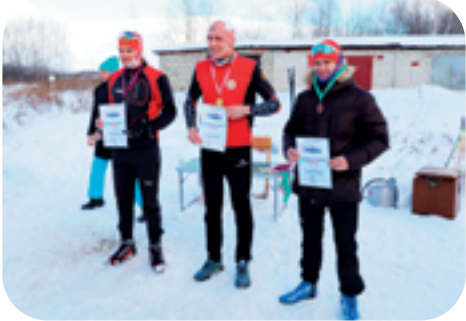
6. 18.02.2023: 6 работников приняли участие в спортивных соревнованиях среди работающей молодежи «Ледовый фреш».