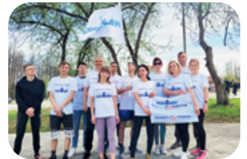
6. Май 2023: наши сотрудники приняли участие в соревнованиях «Забега на трамплин TOP OF THE HILL» в городе Чайковском.