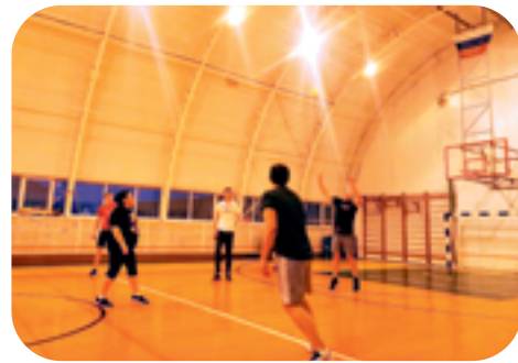
12. Апрель 2023: участие 6 сотрудников в Муниципальных соревнованиях по баскетболу в зачет Спартакиады трудовых коллективов.